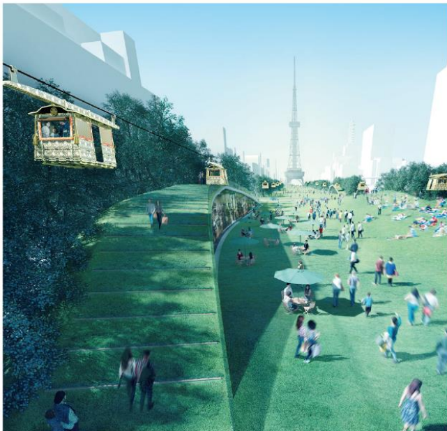
NSRI フォーラムにて将来像提案 一部抜粋